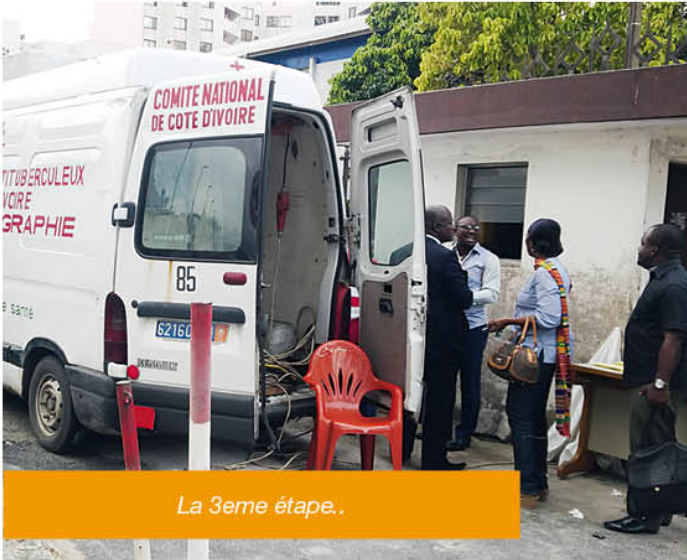
La 3eme étape..