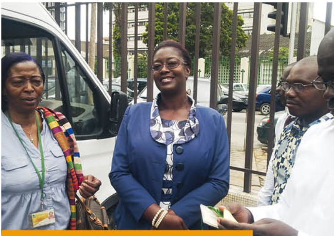
...au camion mobile..