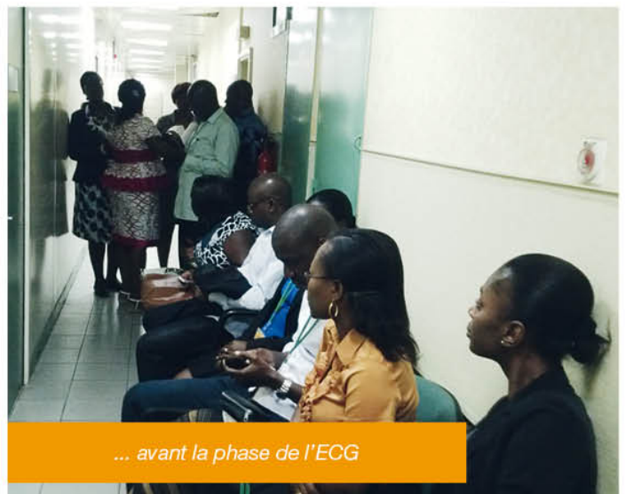
... avant la phase de l'ECG