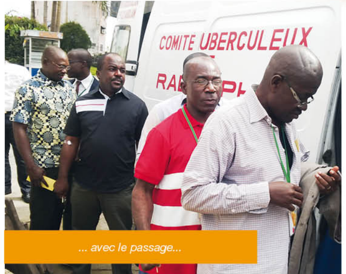
... avec le passage...