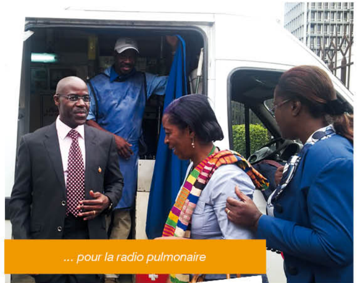
... pour la radio pulmonaire