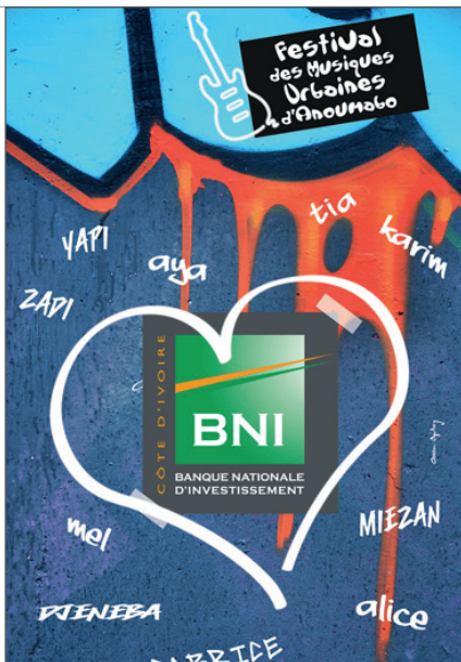
> La banque officielle du FEMUA