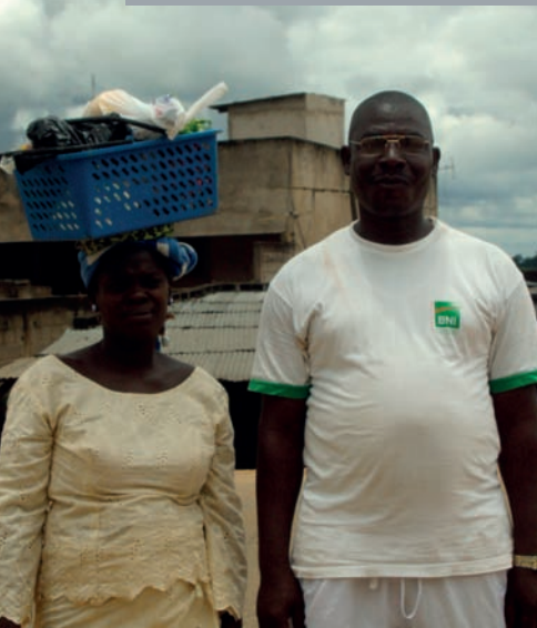
La photo du mois