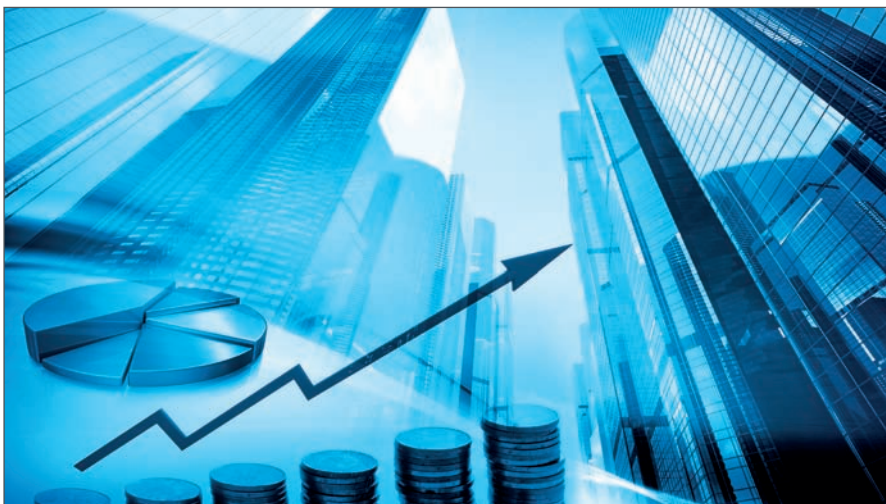
➤ Accroissement de la notoriété