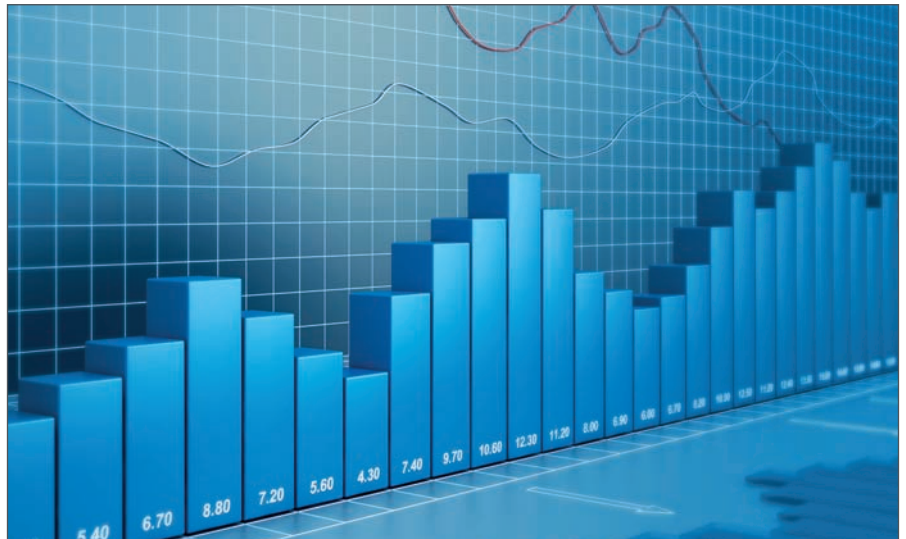
> Les modalités de l'introduction en bourse

d'une évaluation objective de l'entreprise. En fait, le cours est le résultat d'une analyse destinée à arbitrer des intérêts apparemment contradictoires (public, actionnaires cédants, marché) :