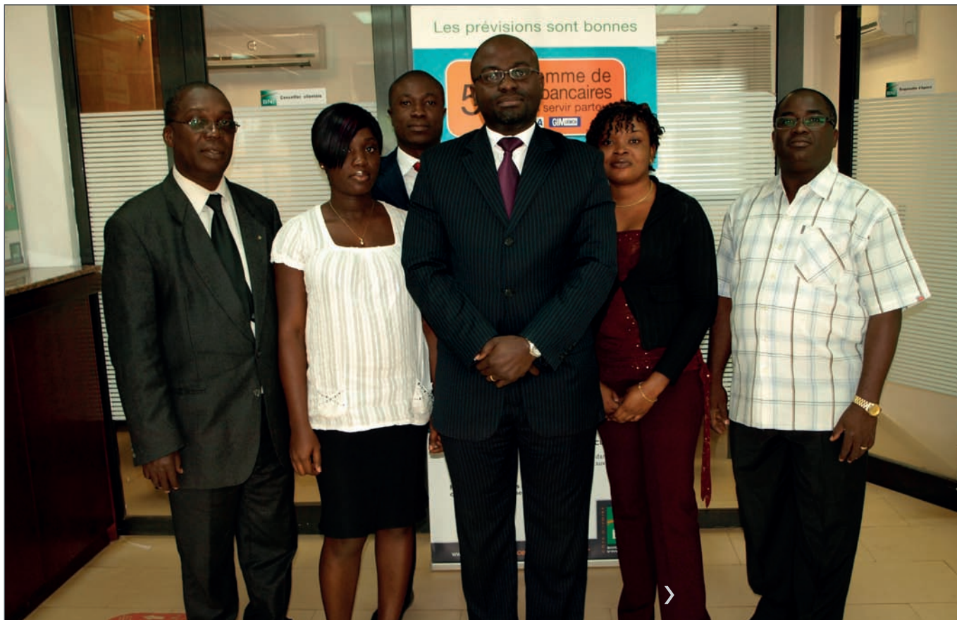
› L'équipe de l'agence BNI Dabou

A la suite de l'expédition menée par le commandant BAUDIN, commandant de la station navale des côtes occidentales d'Afrique et de la reconnaissance de la souveraineté française par les chefs de Débrimou, Louis FAIDHERBE fit construire un fort en bordure de la lagune Ebrié. Et c'est autour de ce fort que la ville de Dabou fut construite.