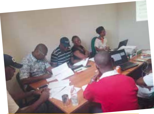
Vue de quelques participants

Le mercredi 14 Octobre, est intervenu le lancement de la commercialisation du nouveau produit de bancassurance de la BNI, dénommé Epargne Gagnante BNI .